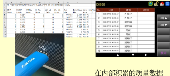
在内部积累的质量数据