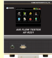
可通过以太网共享在内部积累的质量数据